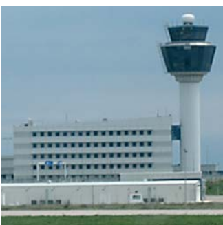
Eleftherios Venizelos: So heißt der neue Athener Flughafen.

Die griechische Luftfahrtbehörde Hellenic Civil Aviation Authority (HCAA) in Athen, erteilte der EMPIC GmbH einen neuen Auftrag zum Ausbau der medizinischen Lösung (FCL-M). Inzwischen sind die beauftragten Arbeiten durchgeführt und der Kunde kann demnächst auf die neue Lösung umsteigen.