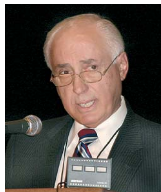
Leiter für Luftsicherheit der amerikanischen Luftfahrtaufsichtsbehörde: Nicholas A. Sabatini.

„Die Lücke muss mit Tools gefüllt werden,“ forderte der FAA-Chef Sabatini. Und in diese Lücke stößt die EMPIC GmbH aus Erlangen mit ihrem Angebot.